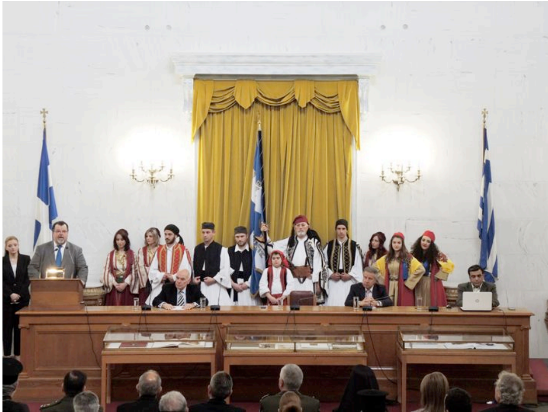
3.- Χαιρετισμός από τον Πρόεδρο της Παγκυπριανής Ενώσεως κ. Δημήτριο Βαρθολομαίου.