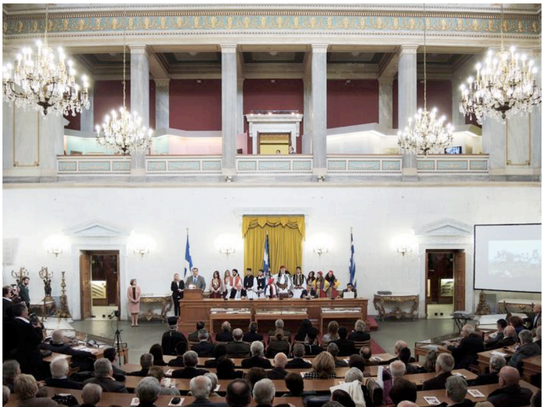
2.- Χαιρετισμός από τον Πρόεδρο της Παγκυπριανής Ενώσεως κ. Δημήτριο Βαρβιτσιώτη.