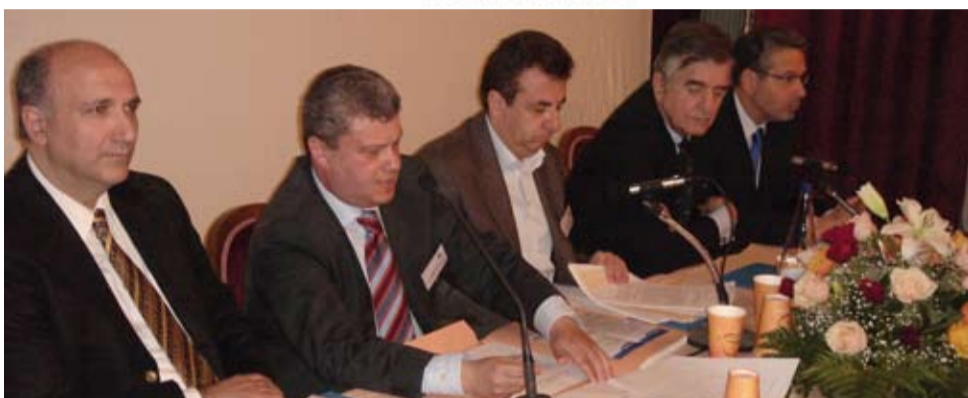
φωτο εξ αριστερών: Μανώλης Αγγελιάκας, Ευρωβουλευτής Ν.Δ. - Δρ. Ι. Καλαβρουζιώτης, Επίκουρος Καθηγητής Πανεπιστημίου Ιωαννίνων, Πρόεδρος Φ.Δ. Λιμνοθάλασσας Μεσολογγίου - Σταύρος Αρναουτάκης, Ευρωβουλευτής ΠΑ.ΣΟ.Κ. - Πρέσβης κος Γεώργιος Γεωργίου, Ευρωβουλευτής ΛΑ.Ο.Σ - Γεώργιος Κασιμάτης, Διευθυντής Γραφείου για την Ελλάδα του Ευρωπαϊκού Κοινοβουλίου

Με την συμμετοχή των Ευρωβουλευτών κκ. Μανώλη Αγγελιάκα, Σταύρου Αρναουτάκη, Γεωργίου Γεωργίου και του Γεωργίου Κασιμάτη, Διευθυντή του γραφείου του Ευρωπαϊκού Κοινοβουλίου στην Αθήνα, αλλά και με την μεγάλη συμμετοχή φορέων και πολιτών της περιοχής διεξήχθη το Σάββατο, 2 Φεβρουαρίου 2008 στο Τρικούπιο Πνευματικό Κέντρο στο Μεσολόγγι, επ' ευκαιρία της Παγκόσμιας Ημέρας Υδροτοπιών.