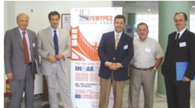
Σε επίσημο θεσμό εξελίσσεται το συνέδριο "Γέφυρες". Στημιότυπο από την τελευταία εκδήλωση, Ιούνιος 2003. Στη φωτογραφία μέλη του δ.σ. του ΙΝ.Α.Δ.Ε. και ομιλητές του συνεδρίου.

Ανάμεσα στους κύριους στόχους του ΙΝΑΔΕ είναι η έρευνα, μελέτη και διατύπωση προτάσεων για την επίλυση των κοινωνικοοικονομικών προβλημάτων, και η βελτίωση του επιπέδου ζωής των πολιτών, η τόνωση της οικονομικής δραστηριότητας και η ανύψωση του πολιτισμικού και εκπαιδευτικού επιπέδου. Παράλληλα, το Ινστιτούτο ασχολείται με την έρευνα, μελέτη και διατύπωση προτάσεων σχετικά με νέους τρόπους οργάνωσης και διοίκησης για την οικονομική αναδιάρθρωση, την παραγωγικότητα και αποτελεσματικότητα σε όλα τα οικονομικά πεδία και επίπεδα. Η προαγωγή και αξιοποίηση της υψ-