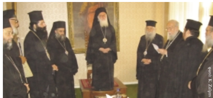
Στημιότυπο από την περσινή εκδήλωση του εορτασμού της εκκλησίας. Δοξολογούν ο μακαριότατος Αρχιεπίσκοπος Αλβανίας κ.κ. Αναστάσιος και ο Σεβασμιότατος Μητροπολίτης πατρών κ.κ. Νικόδημος και άλλοι ιερείς.

Όμως, δεν αρκεί η προσφορά του Αγίου και η αγάπη προς αυτόν, αλλά αναγκαία και στην εποχή μας με την τιμή στον Άγιο η μίμηση του Αγίου για να μπορούν να κτυπούν οι καρμάνες της Ορθοδοξίας.